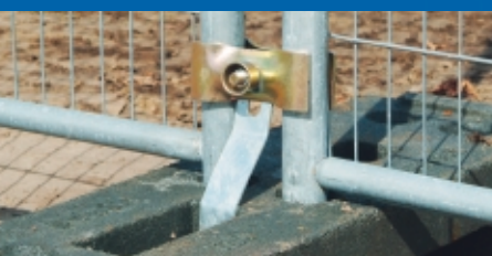
Le système anti-levage empêche de soulever les panneaux pour les extraire des plots.