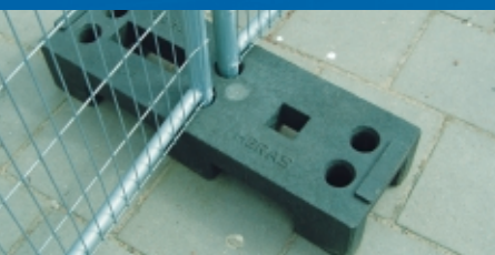
Plot en plastique; stable, facile à utiliser et résistant.

Monter un mur avec des barrières de chantier au prix abordable