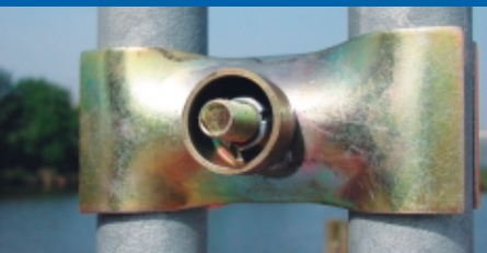
Un accessoire répondant aux nouveaux standards de sécurité: le collier Haute Sécurité.