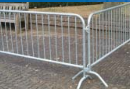
Barrière de ville

Clôture de chantier hauteur 1 mètre (M50), barrière marathon et barrière de ville