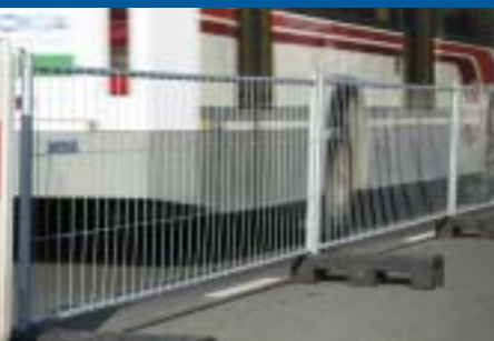
Clôture de chantier hauteur 1 mètre